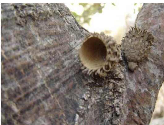
شکل ۱: پیاله، برگ و میوه‌ی بلوط ایرانی (از پایین به بالا)

مطالعاتی از جنبه‌ی اکولوژی، فیزیولوژی، سیستماتیک، شناسایی ترکیبات شیمیایی و ... بر روی درختان بلوط صورت گرفته است. اما فراوانی مطالعات میکروبی نسبت به سایر مطالعات کمتر است.