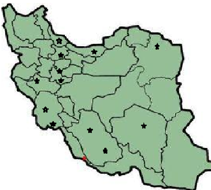
شکل ۱: موقعیت قرارگیری کارخانجات سیمان مورد بررسی در این پژوهش روی نقشه ی ایران

سپس این پرسشنامه ها مورد ارزشیابی اولیه و در نهایت مورد عملیات تعیین روایی توسط متخصصین محیط زیست در کارخانجات مربوطه قرار گرفت. پایایی پرسشنامه با استفاده از روش آزمون - پس آزمون تعیین و ضریب همبستگی ۰/۸۷ به دست آمد. از بین ۳۴ کارخانه ی سیمان موجود در ایران، ۱۲ کارخانه به صورت تصادفی به عنوان نمونه انتخاب و بررسی های آماری بر روی آن ها انجام شد و هنگام انتخاب کارخانه ها تصمیم گرفته شد که در هر منطقه از کشور (شامل: شرق، غرب، شمال و جنوب) حداقل یک کارخانه لحاظ شود در نهایت پس از دریافت پرسشنامه های تکمیل شده نتایج وارد نرم افزار SPSS شده و برای بررسی و تجزیه و تحلیل داده ها از آزمون آماری کای دو استفاده گردید. در طی این مقاله به هر یک از کارخانجات یک کد داده شد. به طوری که از هیچ یک این کارخانجات نامی برده نشد. موقعیت قرارگیری کارخانجات در شکل ۱ آورده شده است.